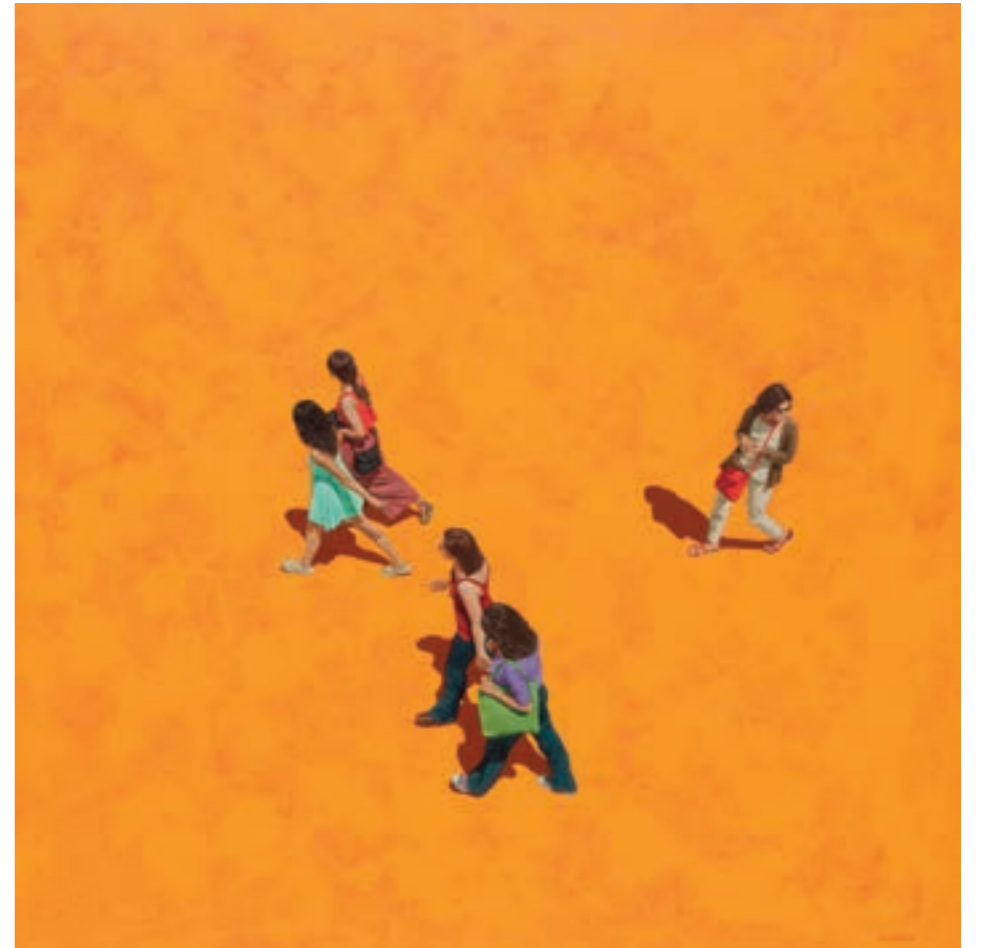
"Versailles" , Acrílico sobre tela, 100 X 100 cm