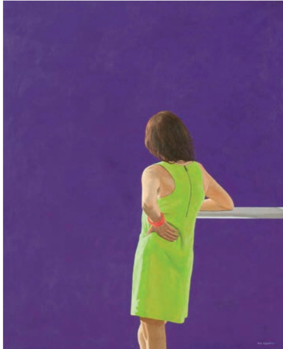
"Me gusta el verano" , Acrílico sobre tela, 100 X 81 cm