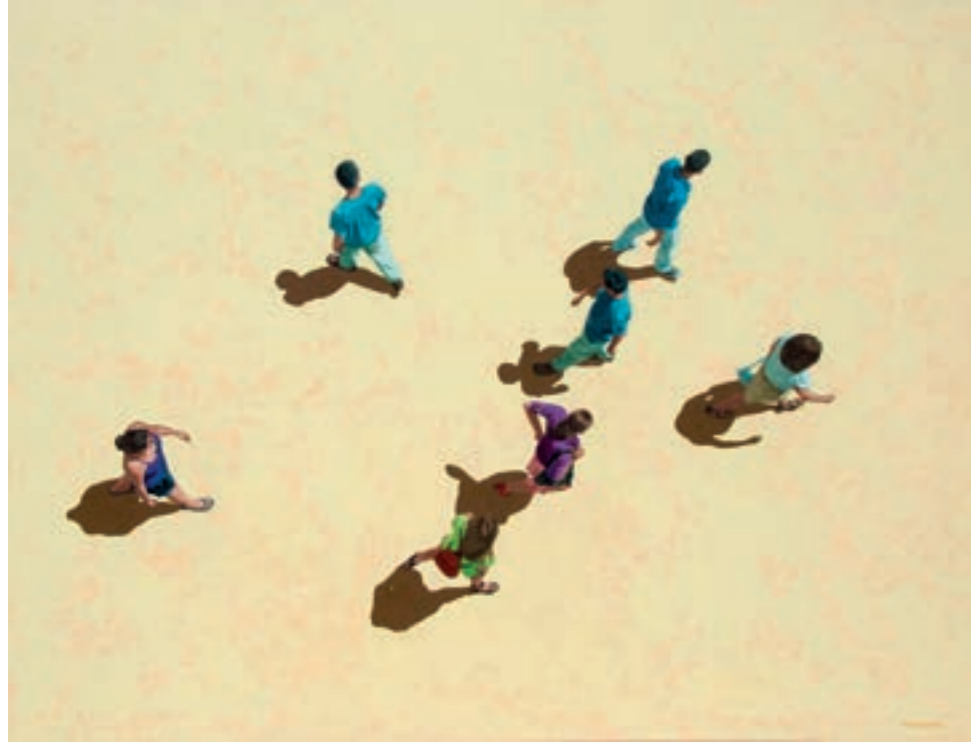
"Mediodía en Córdoba" , Acrílico sobre tela, 89 X 116 cm