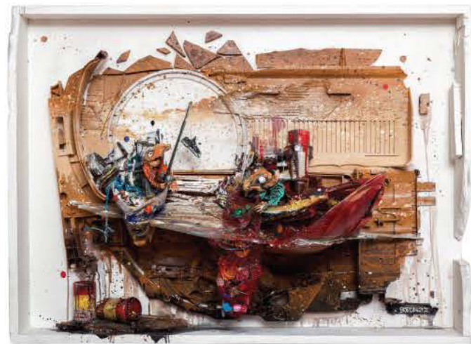
Fish no Fish , 2014 -Técnica mista sobre Assemblage 75 x 103 x420 cm