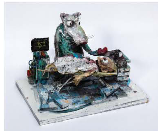
Ciência . Técnica mista sobre Assemblage, 2015

Artur Bordalo aka Bordalo II, nasci em Lisboa em 1987.