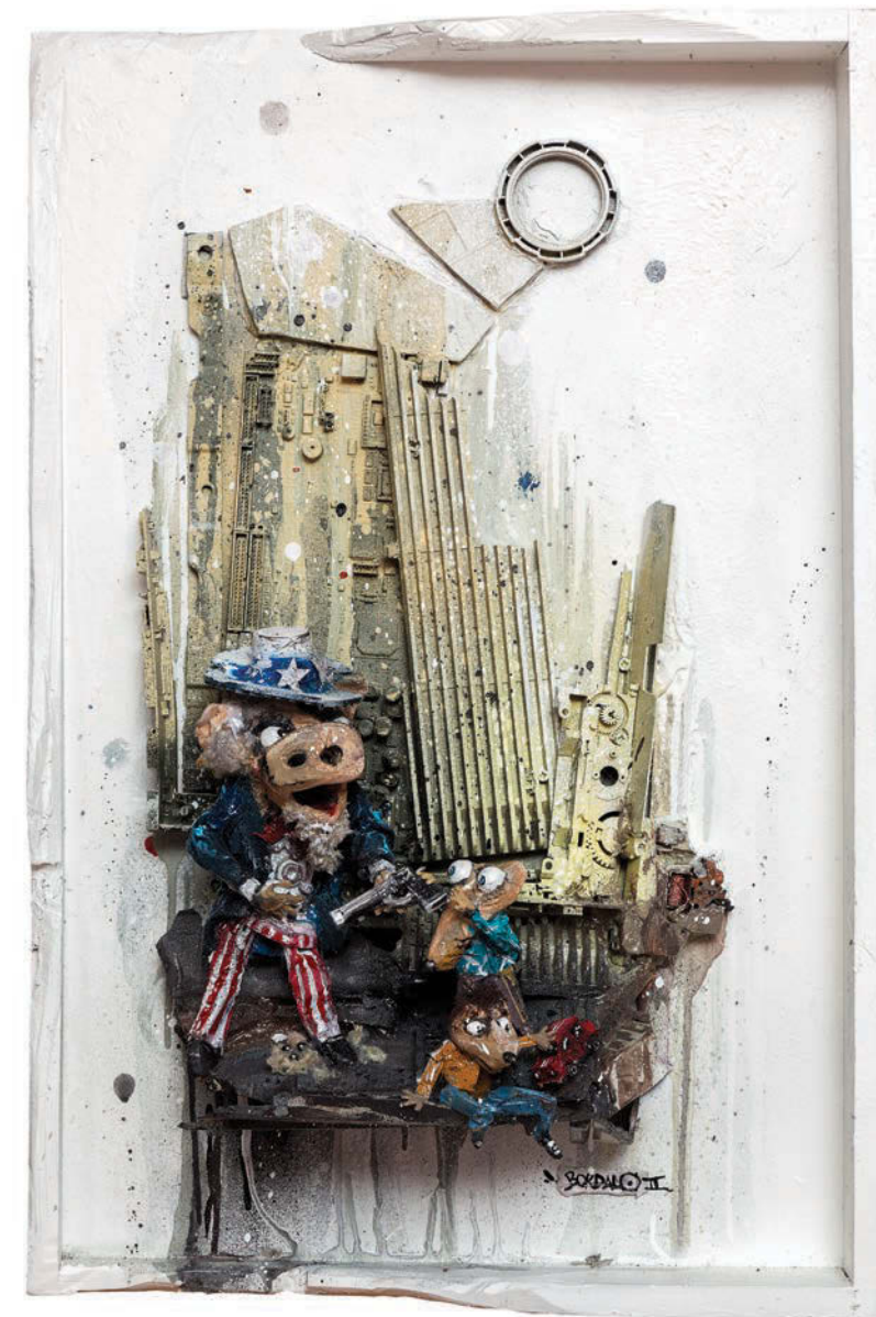
Dirty Sam. Técnica mista sobre Assemblage, 2014 75 x 50 x 25 cm