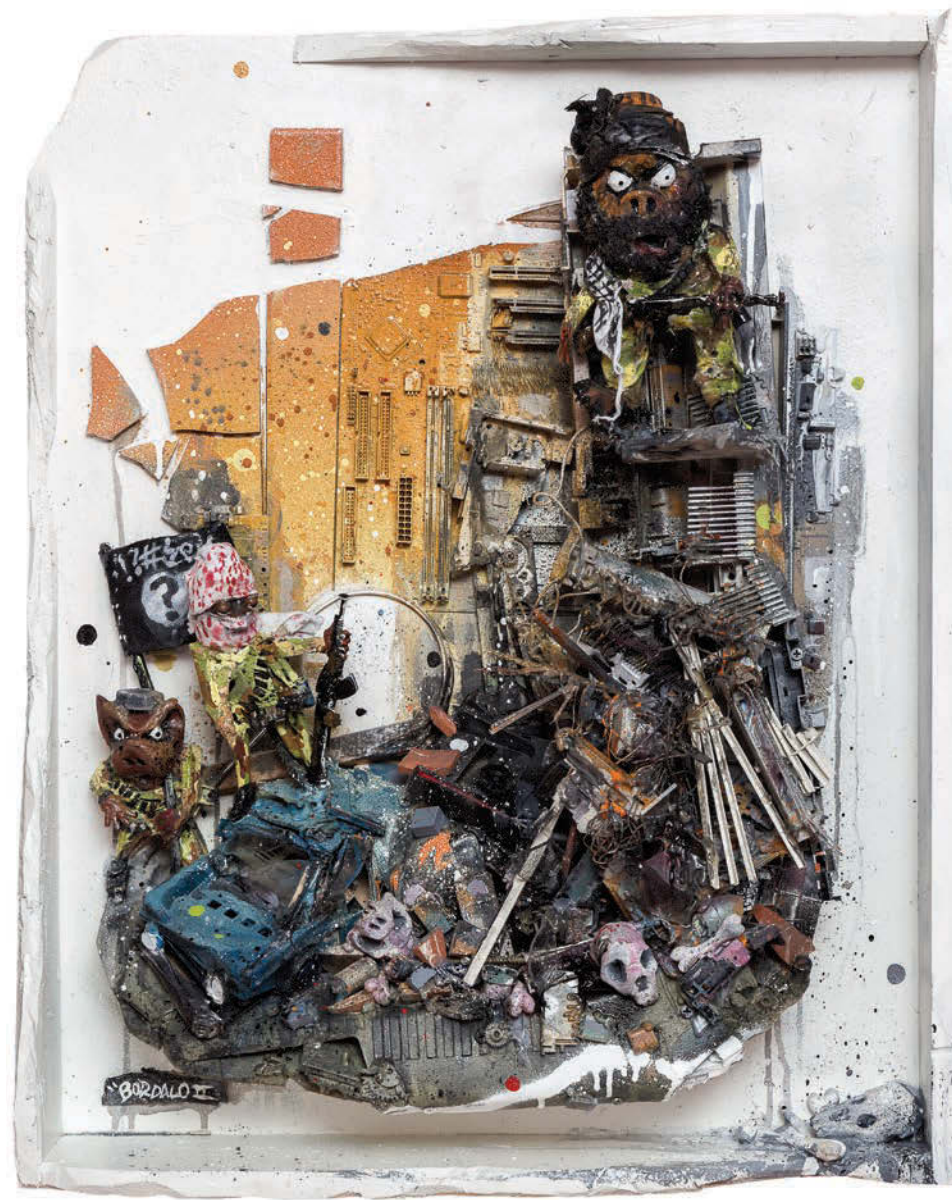
Win ruins. Técnica mista sobre Assemblage, 2015 75 x 61 x 35 cm