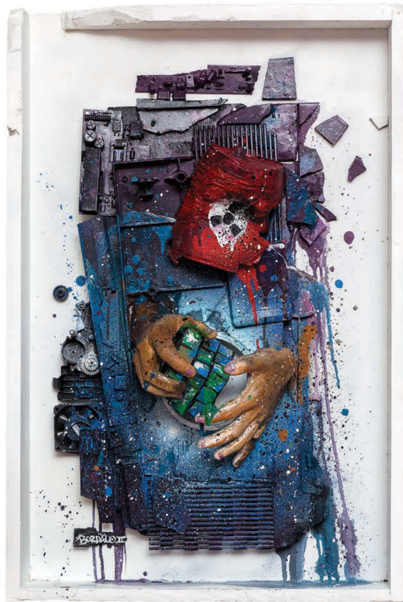
Playing Games. Técnica mista sobre Assemblage, 2014 75 x 50 x 20 cm