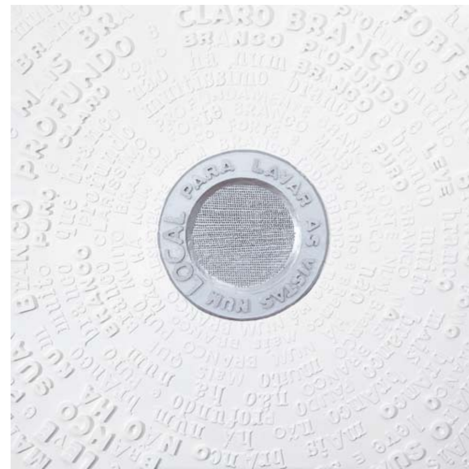
“Local Especial para lavar a vista”, 2011, técnica mista sobre papel, 130x130 cm