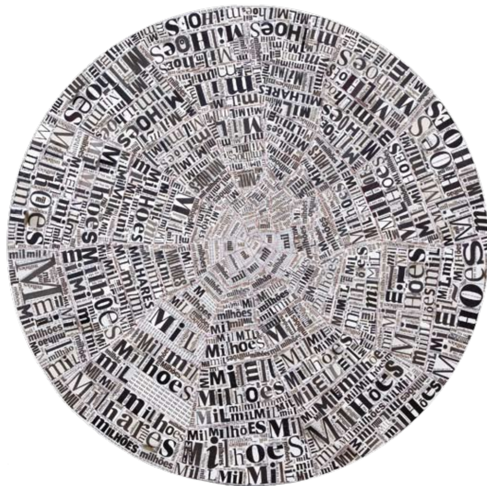
“Rede que nos prende sem sustar”, 2010, técnica mista sobre papel, 130x130 cm