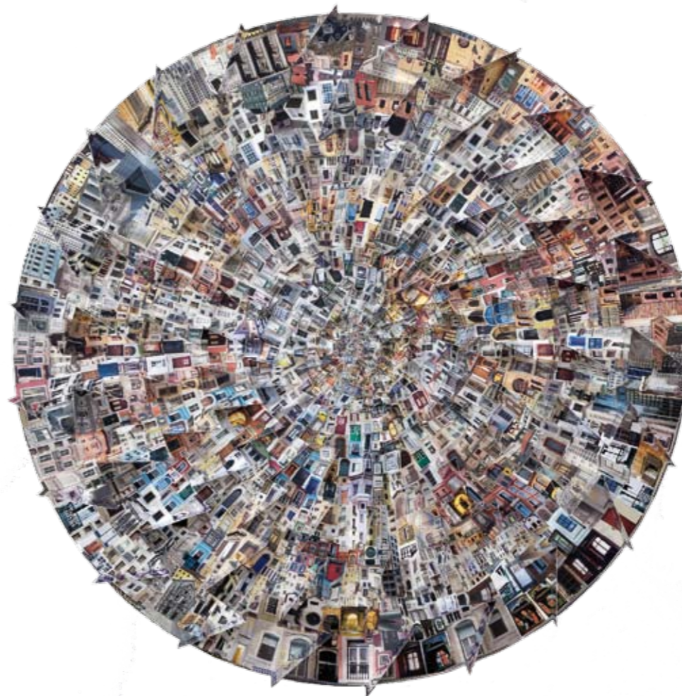
“Quero ver mais portas que paredes”, 2010, técnica mista sobre papel, 130x130 cm