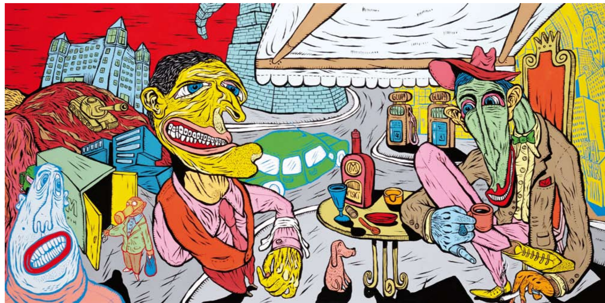
“O Malandro V”, 2011, acrílico sobre tela, 90x197 cm