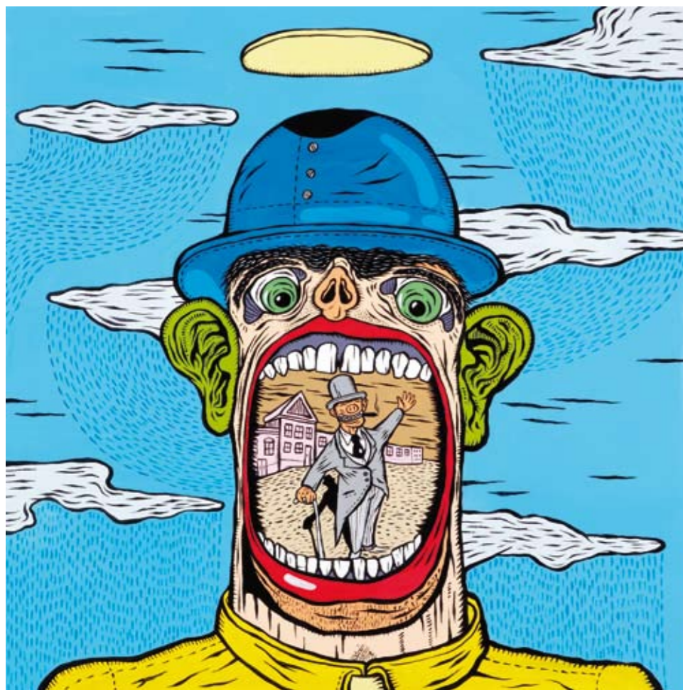
“O Malandro IV”, 2011, acrílico sobre tela, 100x100 cm